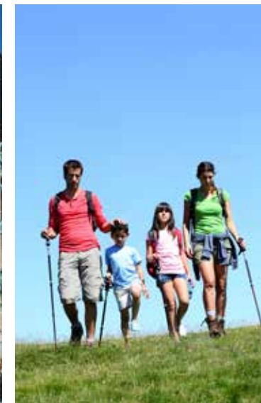
Xarxa de Parcs Naturals