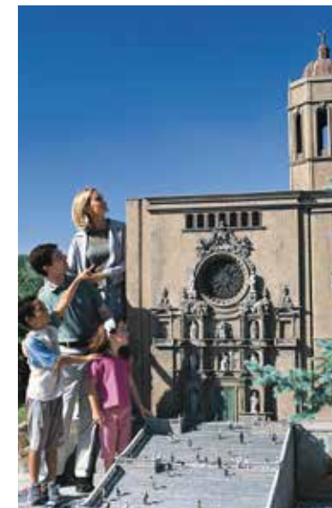
Catalunya en Miniatura

Al voltant de Barcelona s'articula una extensa xarxa de parcs naturals , amb tot tipus d'equipaments relacionats amb la descoberta de la flora i la fauna, envoltats de paisatges i espais sorprenents a prop del mar. L'oferta lúdica a l'aire lliure és la joia del turisme familiar: senderisme, passejades a peu, en bicicleta, segway ..., però també visites teatralitzades, museus interactius, castells i nuclis històrics, són una manera amena i divertida d'apropar-se, amb els més petits, a la riquesa d'un país.