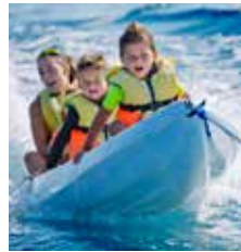
Pineda de Mar