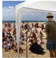
Malgrat de Mar