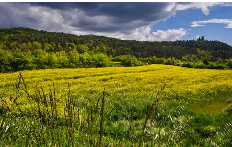
Vista dels paisatges agrícoles a la vora de la Rectoria de Sant Feliu de Terrassola.