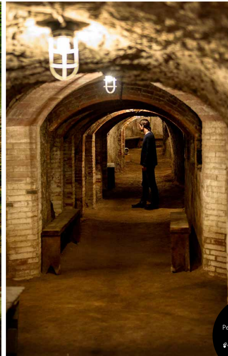
A l'estació de la Garriga es conserva el refugi antiaeri, que es pot visitar. A l'esquerra, la riera de Gualba, al Parc Natural i Reserva de la Biosfera del Montseny.